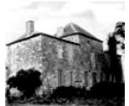
La métairie de la Birondi