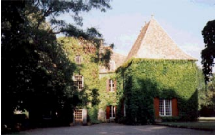
Le Valadou au jourd'hui.